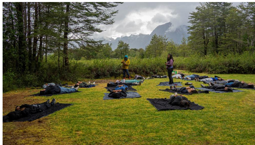
Fundación Kiñewen Elemental Natura

"Unirnos para volver a lo esencial; actuar para que la vida prevalezca."